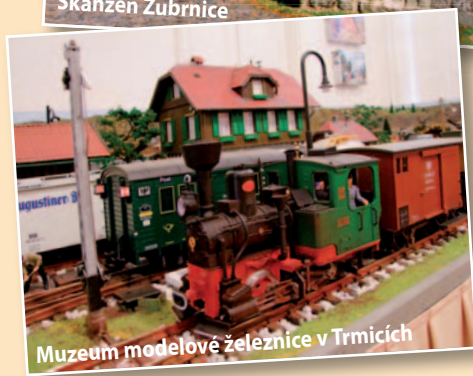
Muzeum modelové železnice v Trmicích