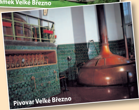
Pivovar Velké Březno